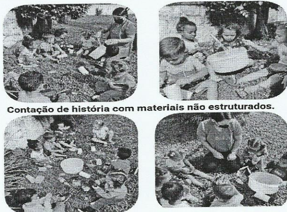
Contação de história com materiais não estruturados.

Durante a história, as educadoras foram passando os diferentes materiais para que as crianças pudessem explorar, como: potes, tampas, talheres, copos e etc.. Os mesmos ficaram entusiasmados e concentrados para participarem deste momento tão significativo e cheio de novidades.