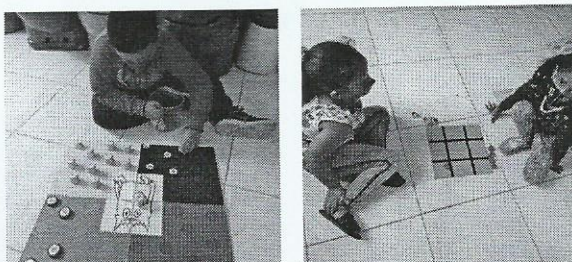
Expolorando diversos jogos.

A proposta realizada pelas educadoras foi cheia de desafios, regras e combinados. As mesmas disponibilizaram diversos jogos de tabuleiros, como: Jogo da velha, jogo dos sentimentos e jogo de tampinhas. As crianças sentaram em duplas e brincaram de forma espontâneas com seus colegas, as educadoras observaram que os mesmos cumpriram todas as regras e combinados dos jogos referentes ao jogo. As crianças aproveitaram o momento se divertindo muito através da interação e parceria com o outro.