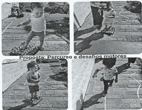
Proposta: Percurso e desafios motores

A atividade proposta realizada pelas Educadoras foi cheia de novas possibilidades e descobertas, as mesmas organizaram no espaço externo da creche um percurso cheio de desafios, utilizando colchonetes, caixa de papelão e fitas no chão. Logo após foram orientado que as crianças andassem pelo percurso da forma que sentisse segura, as mesmas exploraram e se divertiram com os diferentes objetos disponibilizados.