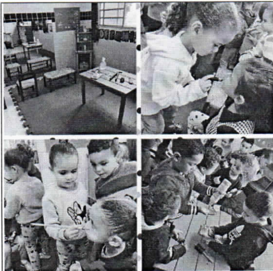
Maternal II B

Campo de experiência: O eu, o outro e o nós.