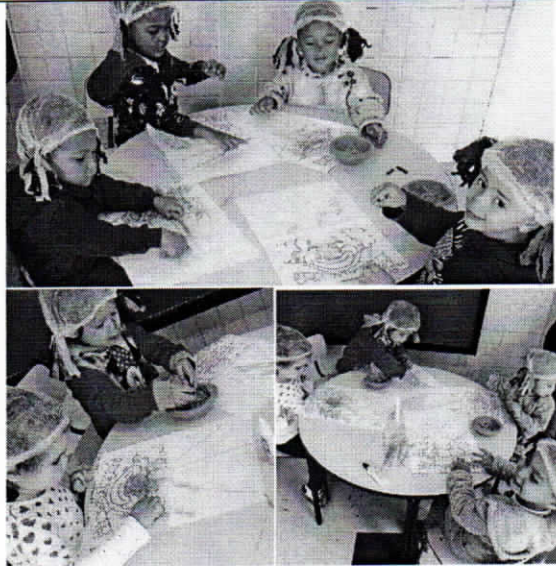
Maternal II B

Campo de experiência: Escuta, fala, pensamento e imaginação